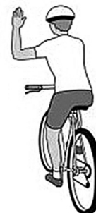
gira a la derecha