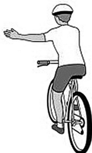
gira a la izquierda

Siempre mostrar a todos antes de volver, cambiar de carril o parar